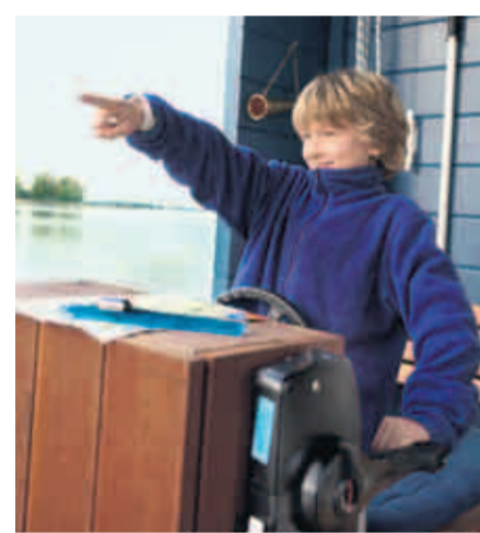
Volle Kraft voraus! Hier kann sich der Nachwuchskapitän mal ausprobieren.

Wendsee, die Havel zwischen Plaue und Bahnitz und den Pritzerber See. Etwas weiter östlich kann man Brandenburg an der Havel und die dahinter liegende Beetzseekette ansteuern. Kein Revier für drei Wochen, aber ein Revier voller sandiger Nischen, voller kleiner Buchten und Seitenarme, in die sich die Bungalowboote mit ihren geringen Wassertiefen vortasten können. Über die Brandenburger Niederhavel fahren wir als nächstes gen Brandenburg, Schilf säumt die Ufer der schmalen Wasserstraße, hin und wieder liegt ein Schiffechen im grünen Dickicht. Und immer wieder: Fischreier. „Die gibt es hier jede Menge“, winkt die burschikose Dame vom kleinen Bootsverleih ab, „die sind nichts Besonderes.“ Doch. Für Städter sind Fischreier etwas Besonderes. Auch die einsamen Flecken sind besonders, die kleinen sandigen Nischen, die unberührte Natur, die Bäume, die sich dem Wind gebeugt haben. Von solchen Plätzen gibt es viele hier an den Ufern der Brandenburger Gewässer.