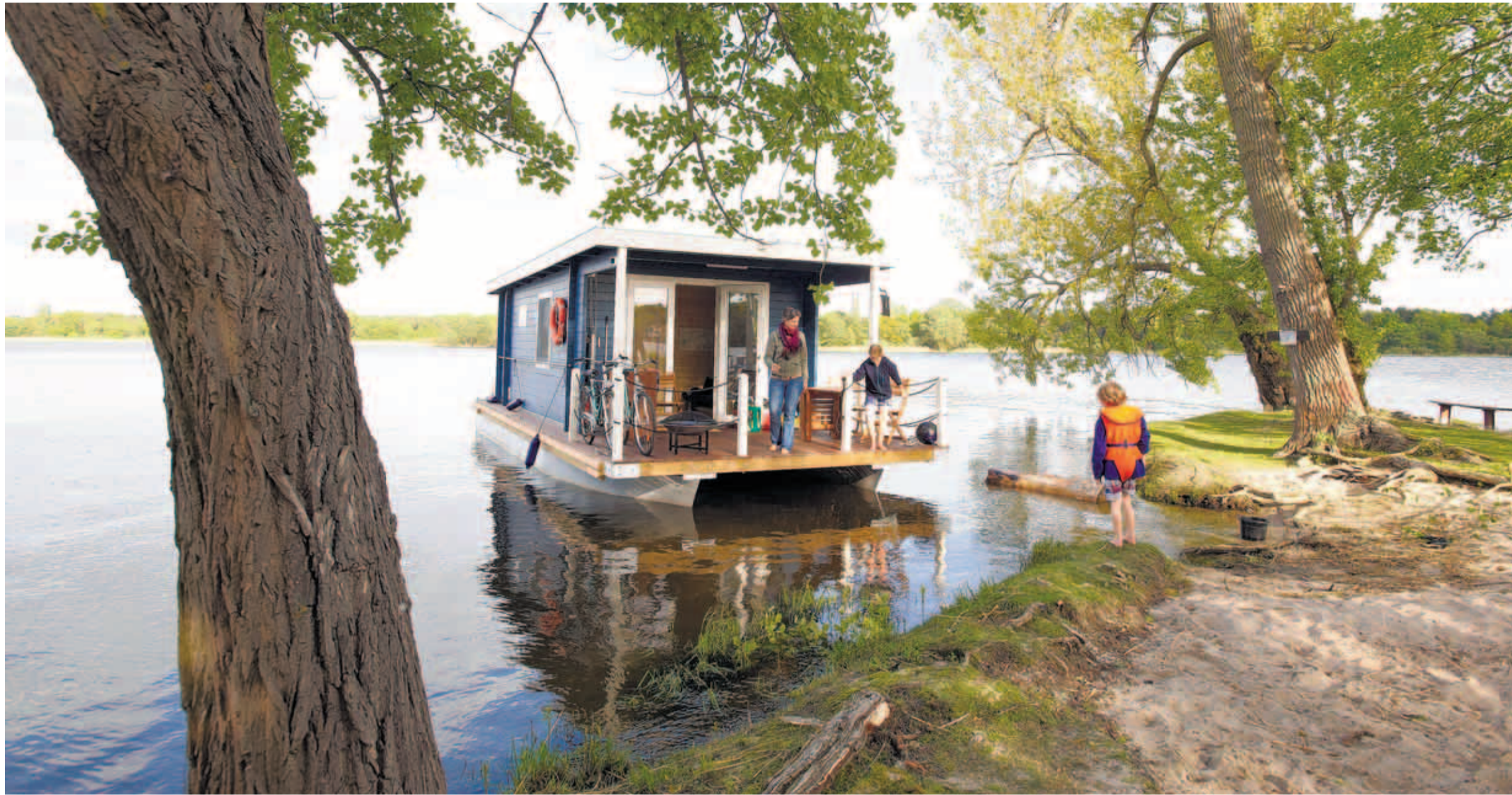
Das An- und Ablegen braucht nur etwas Übung, dann ist es schon ein Kinderspiel – und in der weiten Natur der Brandenburgischen Seen und Flüsse kann auch nicht so viel passieren.

Ibiza Was macht den Charme von Mallorcas kleiner Schwester aus? Seite 3 Online Innenaufnahmen vom Bungalowboot und weitere Fotos Abendblatt.de/reise-hausboot